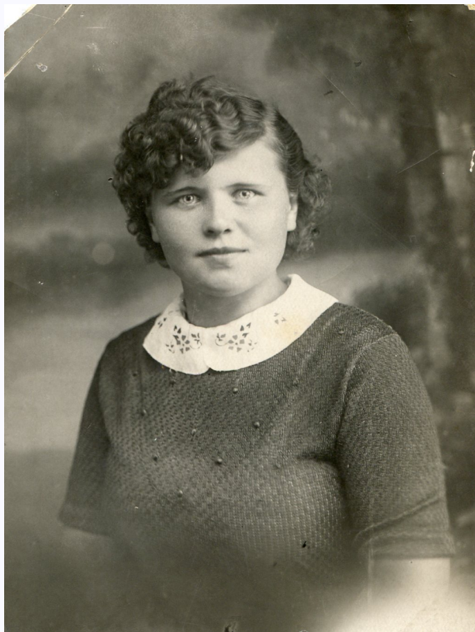
Маруся (м. Антополь) Расстреляна немцами

На память 5/11-38. Кошечка !!! И так всё пройдет незамечено В груди нашей сердце отны Все тогда будет да- леко Не вернется оно ни- когда. Но в душе твоей будет лишь он прошедших годов наша золотая что никуда к нам больше сохранится лишь возвращая память о нем. Кошечка.